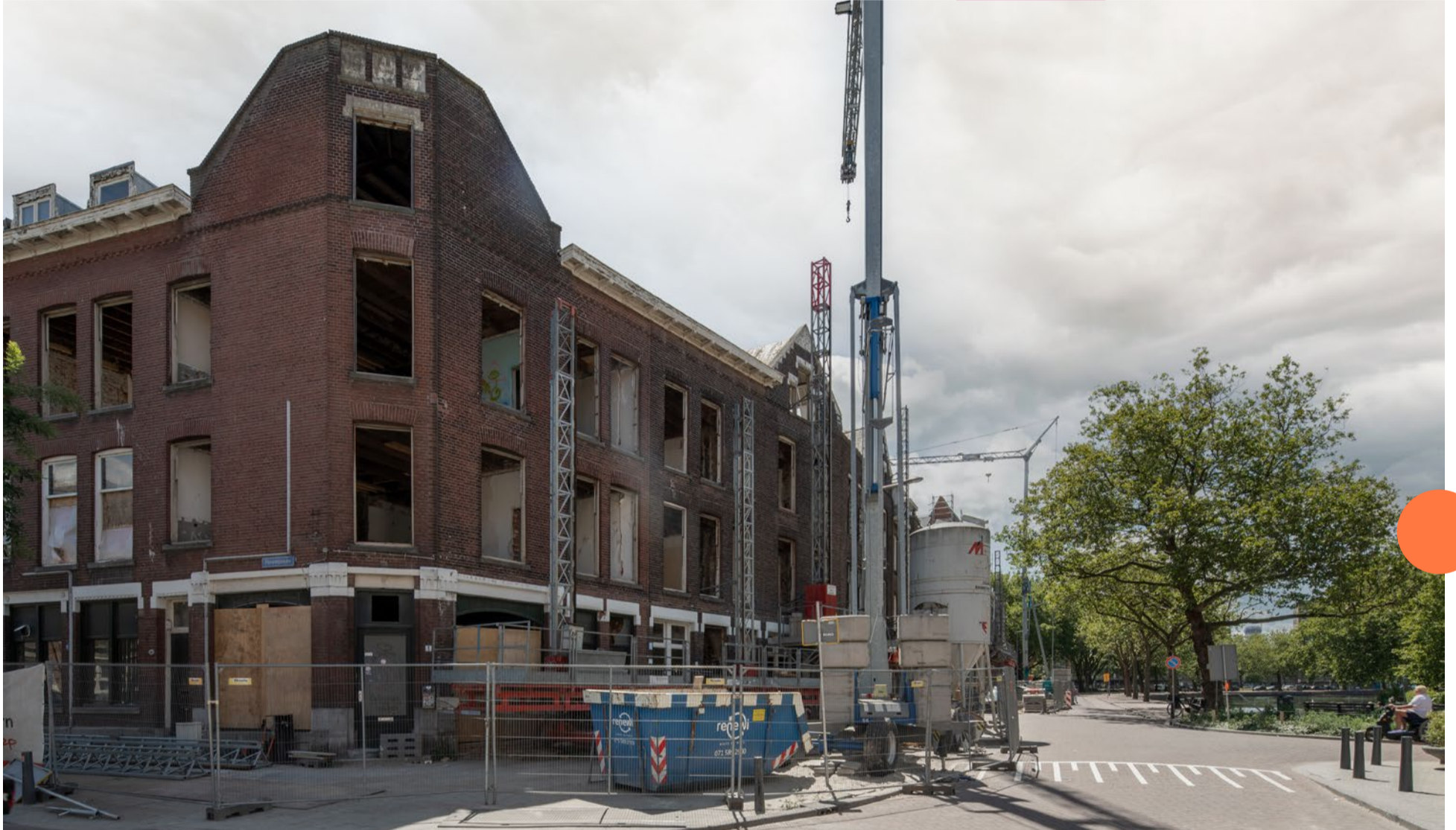
Aan de Linker Rottekade 1 tot en met 5 wordt nu nog hard gewerkt, volgend jaar komen hier twee bedrijfsruimtes beschikbaar.

Nieuws over de ontwikkelingen en het werk in de wijk – december 2022