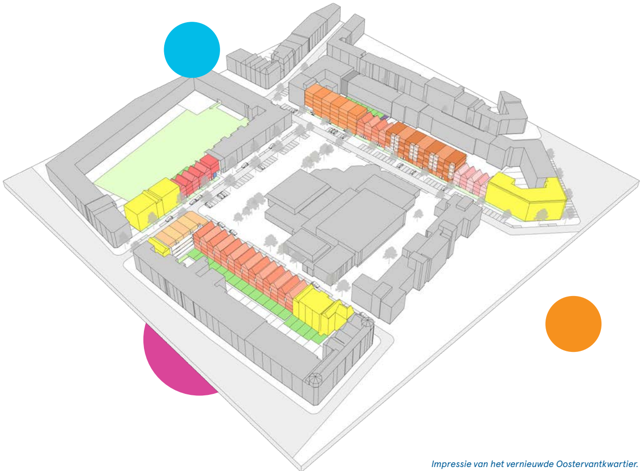
Impressie van het vernieuwde Oostervantkwartier.